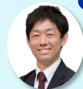
株式会社オービックビジネスコンサルタント